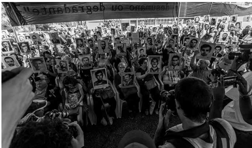
Ato Unificado Ditadura Nunca Mais, em 2019.

O ato busca reafirmar a luta por Memória, Verdade, Justiça e Reparação para enfrentar questões pendentes de nossa história de violência e impunidade.