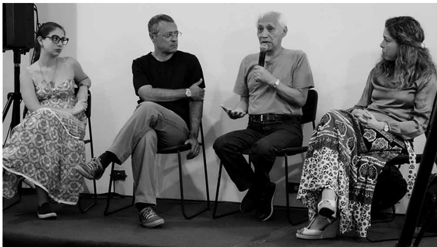
II Ciclo de Cinema, no MLPJ, em 2016.

Entre os anos de 2010 e 2012, foi realizado anualmente o projeto “Cinema e Memória”, na sala Sérgio Cardoso do antigo Cine Bijou, atual Teatro Studio Heleny Guariba, importante local de resistência durante a ditadura. Lá, foram projetados alguns dos filmes com temáticas sociais e revolucionárias, no período considerados subversivos.