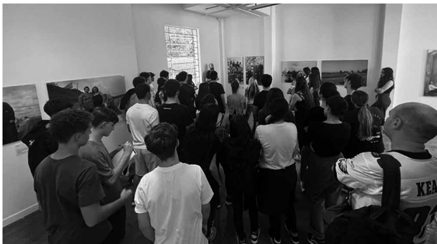
A exposição Ausências Brasil esteve no Centro Universitário MariAntonia, em 2025.

O projeto Ausências teve início na Argentina, em 2007, e posteriormente se expandiu para outros países da América Latina, como Uruguai e Colômbia, documentando vítimas da Operação Condor. No Brasil, foi realizado em 2012.