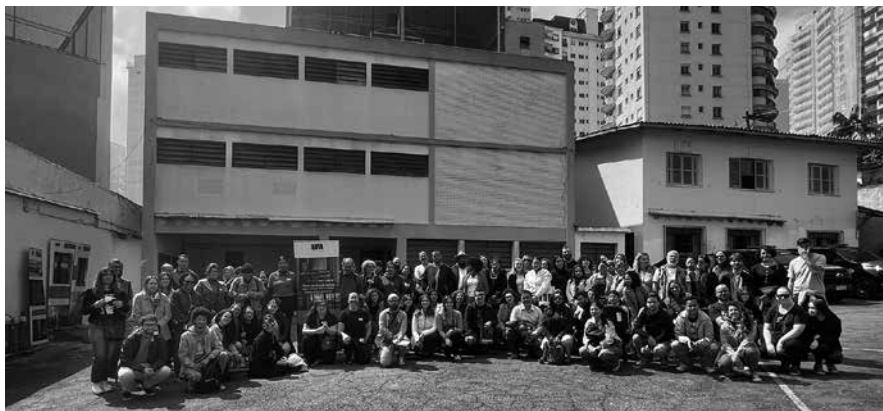
Visita mediada ao antigo DOI-Codi, em 2023.

Dentre outras atividades, como o desenvolvimento de pesquisas e coleta de testemunhos, o GT DOI-Codi tem promovido escavações arqueológicas no local, realizadas por pesquisadores da Universidade Federal de São Paulo (Unifesp), Universidade Estadual de Campinas (Unicamp) e Universidade Federal de Minas Gerais (UFMG), que resultaram na descoberta de mais de 300 artefatos (sob a custódia da Unicamp) e inscrições históricas.