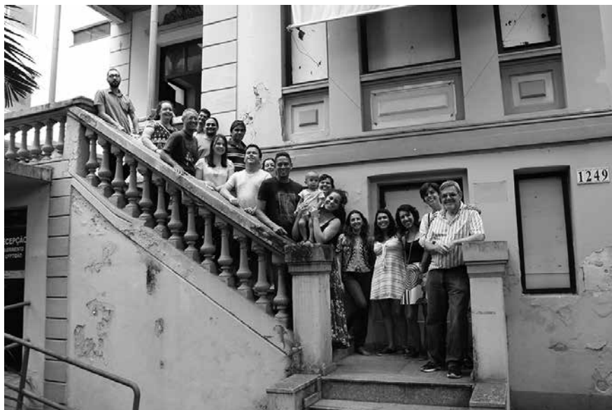
Encontro da Rebralum, no MLPJ, em 2019.

Um exemplo disso é o esforço em buscar meios para colaborar com o desenvolvimento e a consolidação da Rede. Em 2024, o Núcleo Memória foi contemplado com emenda parlamentar da deputada federal Juliana Cardoso para o desenvolvimento do projeto "Preservação da memória política nos 60 anos do golpe: conhecer o passado; entender o presente; construir o futuro", tendo como uma de suas metas o Fortalecimento Institucional da Rebralum.