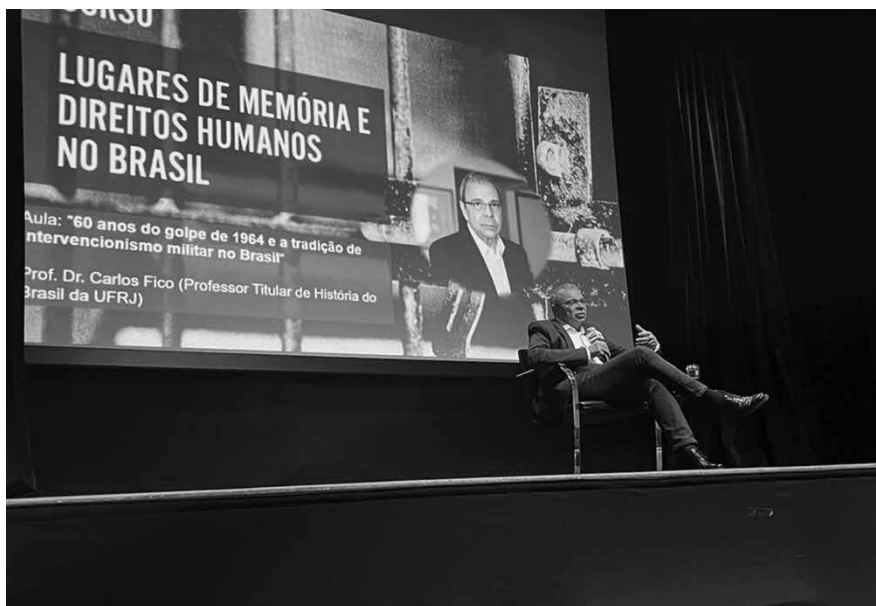
O historiador e professor Carlos Fico na aula inaugural do curso Lugares de Memória e Direitos Humanos no Brasil, no Sesc Vila Mariana, em 2024.

O curso é realizado anualmente em diferentes instituições, como o Museu da Cidade (2019), o Centro Cultural MariAntonia (2023), o SESC Vila Mariana (2024) e o Arquivo Histórico Municipal (2025). Nos anos de 2020 e 2021, o curso foi realizado no formato virtual, em virtude da Pandemia de Covid-19, e a partir de 2022 em formato híbrido (presencial e virtual).