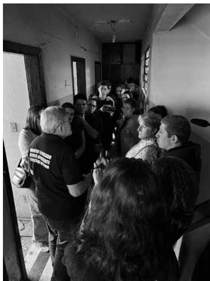
Visita mediada ao antigo DOI-Codi, em 2025.