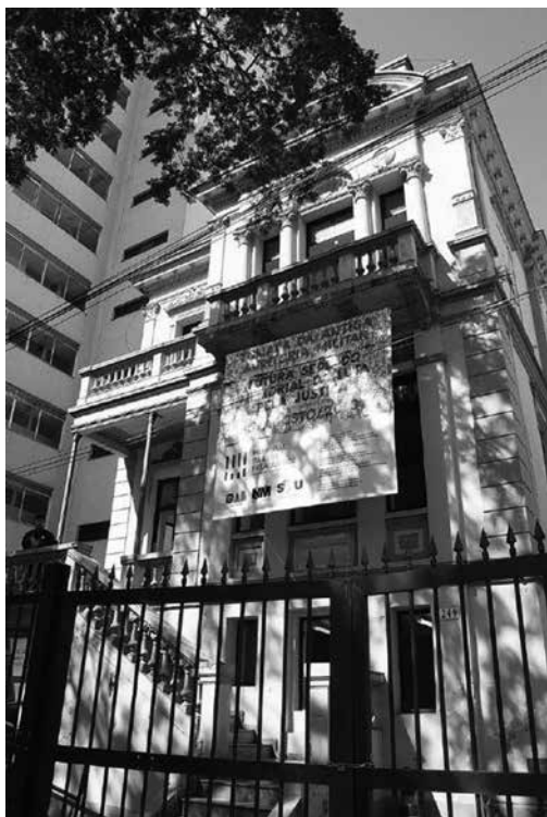
Fachada do futuro Memorial da Luta Pela Justiça, em 2013.

Durante a ditadura militar, aqueles que fossem contrários à ordem estabelecida eram considerados inimigos internos do Estado e enquadrados na Lei de Segurança Nacional. Com a implantação do Ato Institucional nº 2, em 1965, ampliou-se o poder da Justiça Militar, trazendo para sua jurisprudência os crimes políticos de civis. Esses julgamentos buscavam dar ares de legalidade aos inquiridos e processos forjados em prisões ilegais e confissões obtidas em sessões de tortura, que muitas vezes culminavam em assassinatos e desaparecimentos.