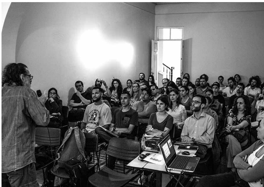
Alunos do curso Ditadura: História e Memória, no MLPJ, em 2016.

ditadura militar brasileira (1964-1985) e seus impactos no presente. Além disso, busca discutir a pedagogia dos lugares de memória, entendendo o patrimônio como uma ferramenta fundamental para estabelecer conexões entre passado e presente e fomentar o diálogo sobre democracia, cenário político atual e Direitos Humanos.