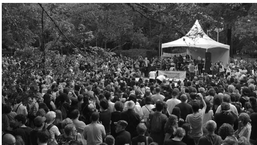
I Caminhada do Silêncio, no Parque Ibirapuera, em 2019.